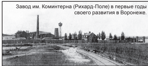
Завод им. Коминтерна (Рихард-Поле) в первые годы своего развития в Воронеже.

В 1934 году «Электросигнал» выпускает первую партию детекторных приемников П-8. На следующий год - 50 тысяч батарейных радиоприемников БИ-234. Все последующие годы завод наращивает объемы производства,